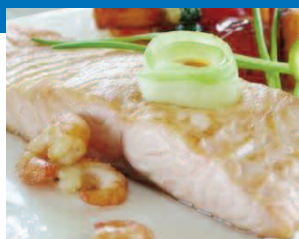
Exemple d'évolution de la flore totale dans un plat cuisiné à base de poisson cuit

Couplés à un conditionnement sous vide ou sous atmosphère protectrice, ils agissent en ralentissant le développement des flores d'altération.