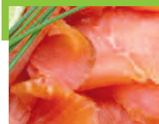
Concentration en Listeria monocytogenes sur saumon fumé conservé à 8°C au cours d'un challenge test

Nous pouvons tester le risque Listeria de vos produits en réalisant des challenge tests, avec des souches issues de l'industrie Agro-Alimentaire, au sein de notre laboratoire et mesurer l'efficacité du ferment LLO®.